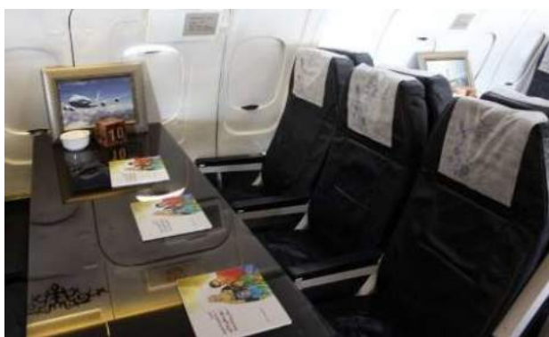
مصرف مواد دخانی استفاده کرد.

وی با اشاره به راه‌اندازی این کافه سلامت گفت: در این کافه استعمال هرگونه مواد دخانی ممنوع است و تمامی میهمانان و گردشگران با کتب و جزوه‌هایی که در زمینه پیشگیری از اعتیاد در اختیارشان قرار می‌گیرد و درج پیام‌ها و توصیه‌های پیشگیرانه از طریق مانیتوری که بر روی هر میز این کافه نصب شده، با پیامدها و خطرات استفاده از انواع موادمخدر و آسیب‌های دخانیات آشنا می‌شوند.