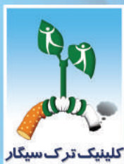
کلینیک ترک سیگار

مصرف دخانیات هر ۶ ثانیه یک قربانی می‌گیرد