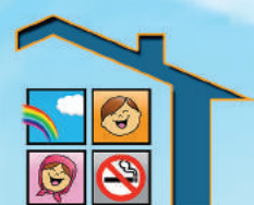
شرازموز «نکس پاک»

مرکز تحقیقات کنترل دخانیات جمعیت مبارزه با استعمال دخانیات ایرانیان