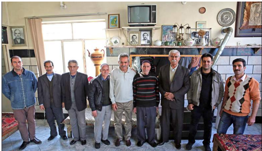
کارگردانی تئاتر می‌خواند.

حضور سینمایی‌ها در قهوه‌خانه، اثرش را روی یکی از پسرهای حاج حسینعلی گذاشت؛ مهدی، این روزها کارشناسی ارشد