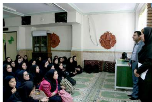
Photo report of peer education and selection of Pad-Yaran (PAD-Helpers) in Varamin County

"Today, increase of tobacco - especially hookah - consumption has been turned to a serious threat to the Iranian society and has taken the attention of decision- and policy-makers of the country", he noted. "In the Soft War arena, enemies try to achieve their targets via increasing the tobacco use throughout the society. Hence, fighting the tobacco epidemics can be accounted as an effective approach against enemies' machinations. Every six seconds, one person dies because of tobacco use, which means 65,000 deaths annually. These