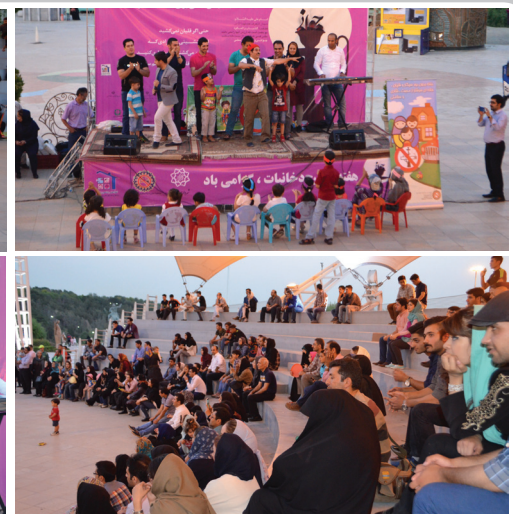
یکشنبه ۹ خرداد، پارک آب و آتش واقع در منطقه ۳