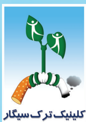
کلینیک ترک سیگار

مصرف دخانیات هر ۶ ثانیه یک قربانی می‌گیرد