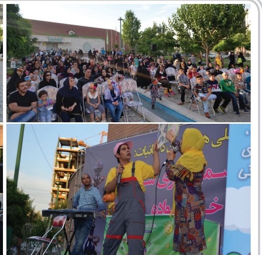
پنجشنبه ۶ خرداد، پارک ولاء واقع در منطقه ۲۰