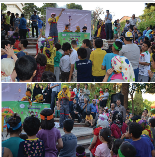
چهارشنبه ۵ خرداد، پارک خیام واقع در منطقه ۱۳