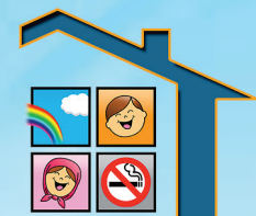
فرآموز «نفس پاک»

مرکز آموزش مهارت‌های رفتاری کودکان و نوجوانان