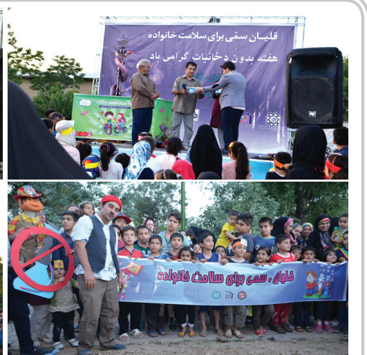
شنبه ۸ خرداد، پارک گلچین واقع در منطقه ۱۵