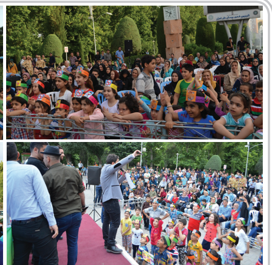
سه شنبه ۴ خرداد، پارک لاله واقع در منطقه ۶