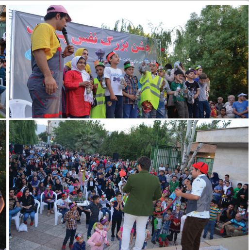
جمعه ۷ خرداد، پارک بسیج واقع در منطقه ۱۴