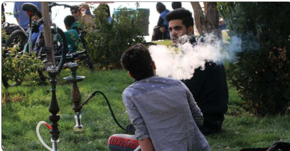
در هفته ملی بدون دخانیات تأکید شد