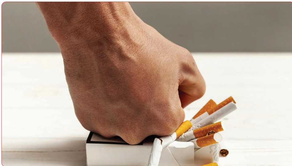
افزایش مالیات سیگار در برنامه هفتم توسعه

در شرایط کنونی همچنان حدود ۵۰ درصد با نرخ موثر مالیات بر مبنای قیمت خرده‌فروشی فاصله داریم. این موضوع هم درحالی عنوان می‌شود که به اعتقاد متخصصان حوزه سلامت، قیمت فعلی خرده‌فروشی محصولات دخانی بسیار پایین است و باید تا حدی افزایش یابد که کاهش مصرف را در پی داشته باشد. به‌رحال از سال ۸۵ که قانون مبارزه با دخانیات تصویب شد تاکنون همچنان در اجرای بند (۸) این قانون که همان افزایش ۱۰ درصد سالانه مالیات بر دخانیات است، اما و اگرهایی وجود دارد و این در حالی است که در این سال‌ها، علاوه بر اجرای این بند، بارها به افزایش نرخ خرده‌فروشی مالیات بر دخانیات، اجرای مالیات ویژه، ساماندهی فروش و تبلیغات نیز تاکید‌های فراوان شده است که باز هم در زمان تصویب و اجرای کامل، میان موافقان و مخالفان در مجلس پاس کاری می‌شود. البته چند روزی است در اکثر خبرگزاری‌ها با تیتراژ افزایش قیمت سیگار در برنامه هفتم توسعه مواجه هستیم، اما هنوز هم با هدف اصلی که همان کاهش مصرف و کسب درآمد پایدار برای دولت است، فاصله زیادی داریم.