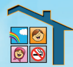
فرآموز (نفس پاک)

مرکز تحقیقات کنترل دخانیات جمعیت عام المنفعه مبارزه با استعمال دخانیات ایرانیان www.tcrcc.org.ir