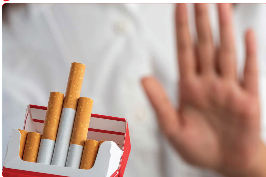
مصرف سیگار در میان زنان ایرانی رشد تصاعدی داشته است