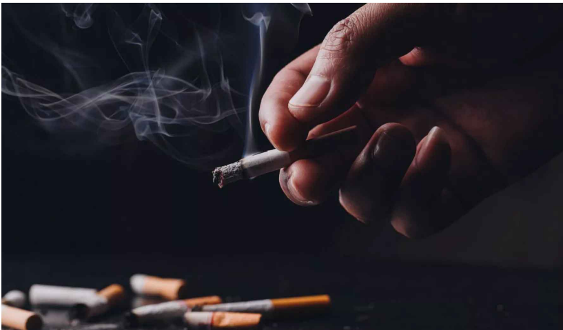
دبیرکل جمعیت مبارزه با استعمال دخانیات ایران :