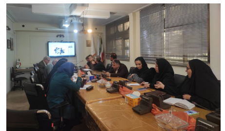
روز یکشنبه مورخ ۲۶ بهمن ماه سال جاری،